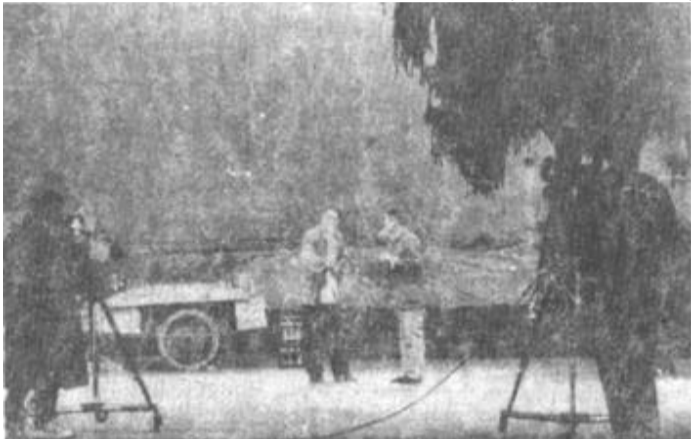
由省文化厅艺术研究所和我市土地管理局联合拍摄的戏曲电视剧《无品土地官》正在紧张的拍摄中。（黄利平 摄）

日前，垦利县吕剧团正在执行电视艺术片《无品土地官》的拍摄任务，他们正以高昂的情绪，为振兴吕剧事业向高层次迈进。（刘芳华）